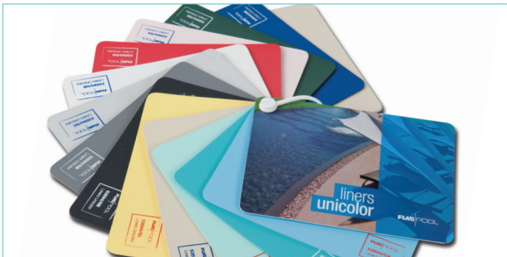
Nuancier Liner armé STANDARD