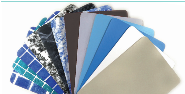
Nuancier Liner armé VERNI